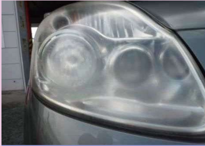
レンズ面のくもり

ロービーム車検適用のため、国交省・陸運局が適正な整備・調整の必要性を訴えています！