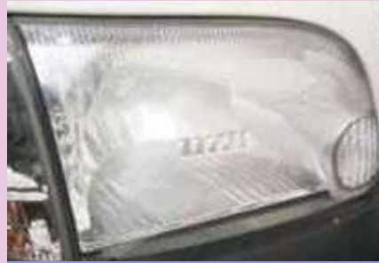
内部リフレクタの劣化